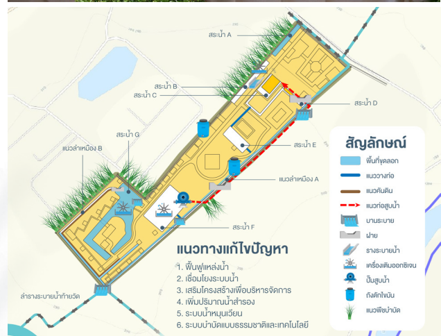
ฝายน้ำภายในวัดป่าพุทธพจน์หรือภูโยช (ธ) ในพระราชูปถัมภ์ฯ